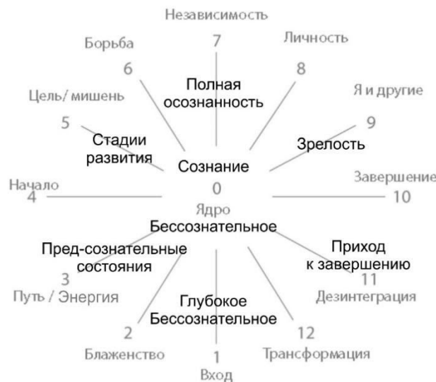
Рис. 2 - Стадии развития жизненного цикла

в зависимости от стадии жизненного цикла. К примеру, начало, зарождения жизненного цикла всего живого, и в том числе человека, начинается с физиологического, клеточного уровня. Затем поступательно переходит в сферу социального, формируется и выстраивается как феноменологическая структура и т.д.